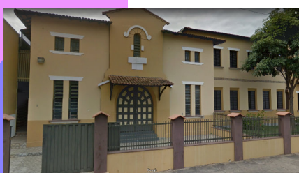
ANFITEATRO DIOCESANO DE IPAMERI Avenida Barão do Rio Branco, nº01 Centro Ipameri-GO